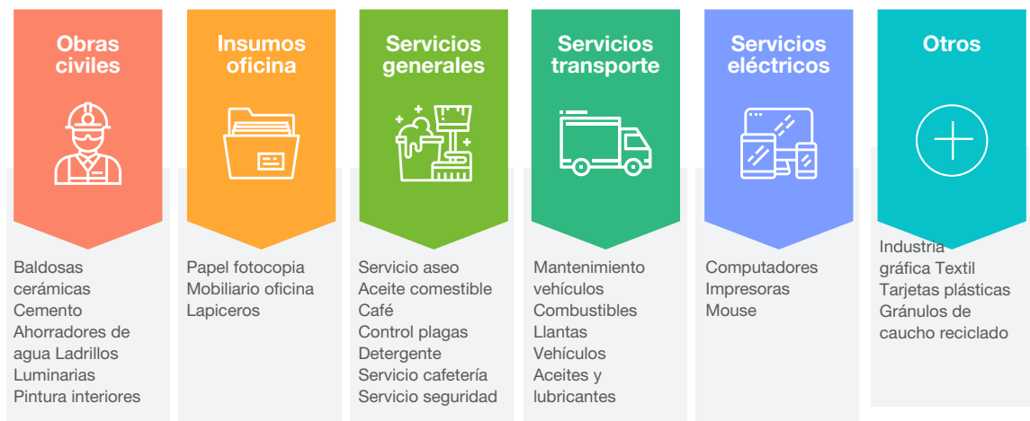
Ilustración 1 Fichas técnicas del Ministerio de Ambiente y Desarrollo Sostenible